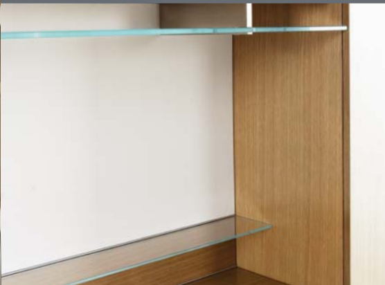
Casiers et tablettes pour dessous d'armoire et cloison recouverte de tissu.