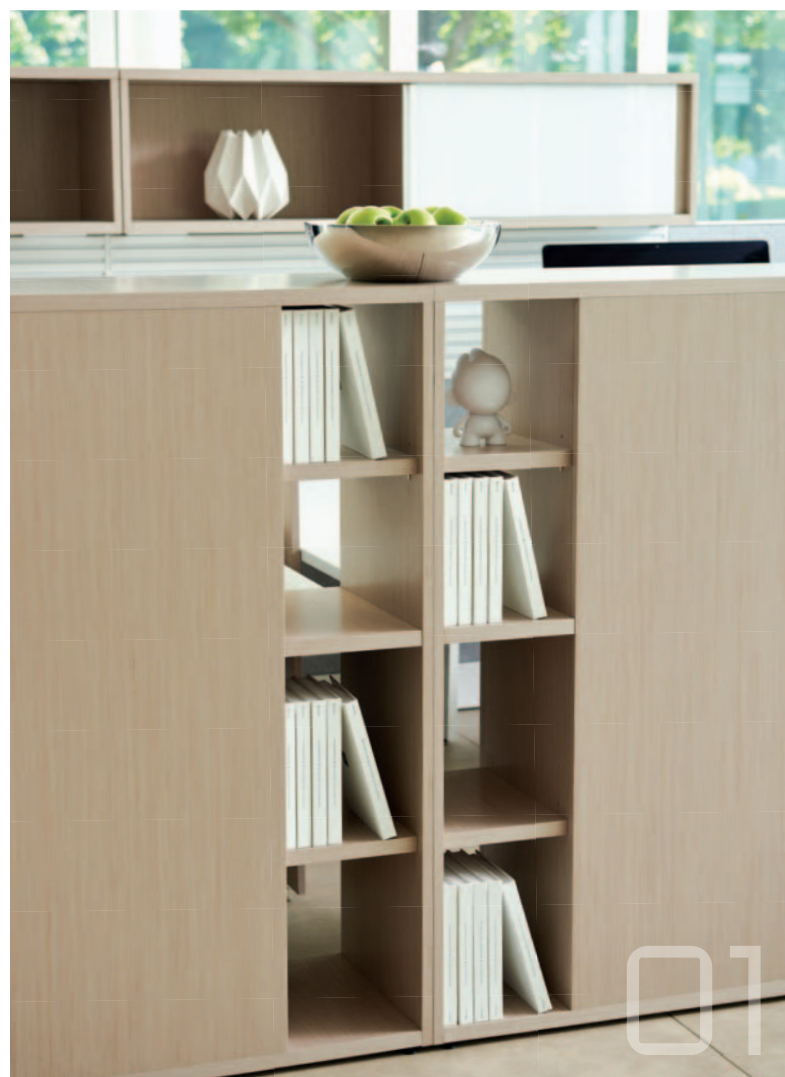
01 rangement district

Les gammes District, Interpret et upStage proposent des éléments de rangement polyvalents pouvant être combinés et configurés pour créer des postes de travail personnalisés. Les finitions assorties et les éléments de design complémentaires permettent d'intégrer les rangements au mobilier des différentes gammes.