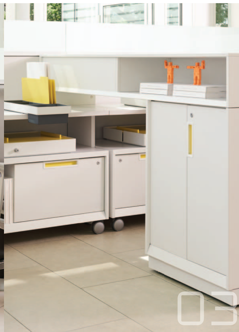
03 armoire latérale en métal interpret

L'armoire latérale en bois Interpret s'installe parallèlement à la surface de travail pour délimiter le poste de travail tout en offrant rangement et intimité et en servant d'espace de réunion en position debout. Aussi offert en métal.