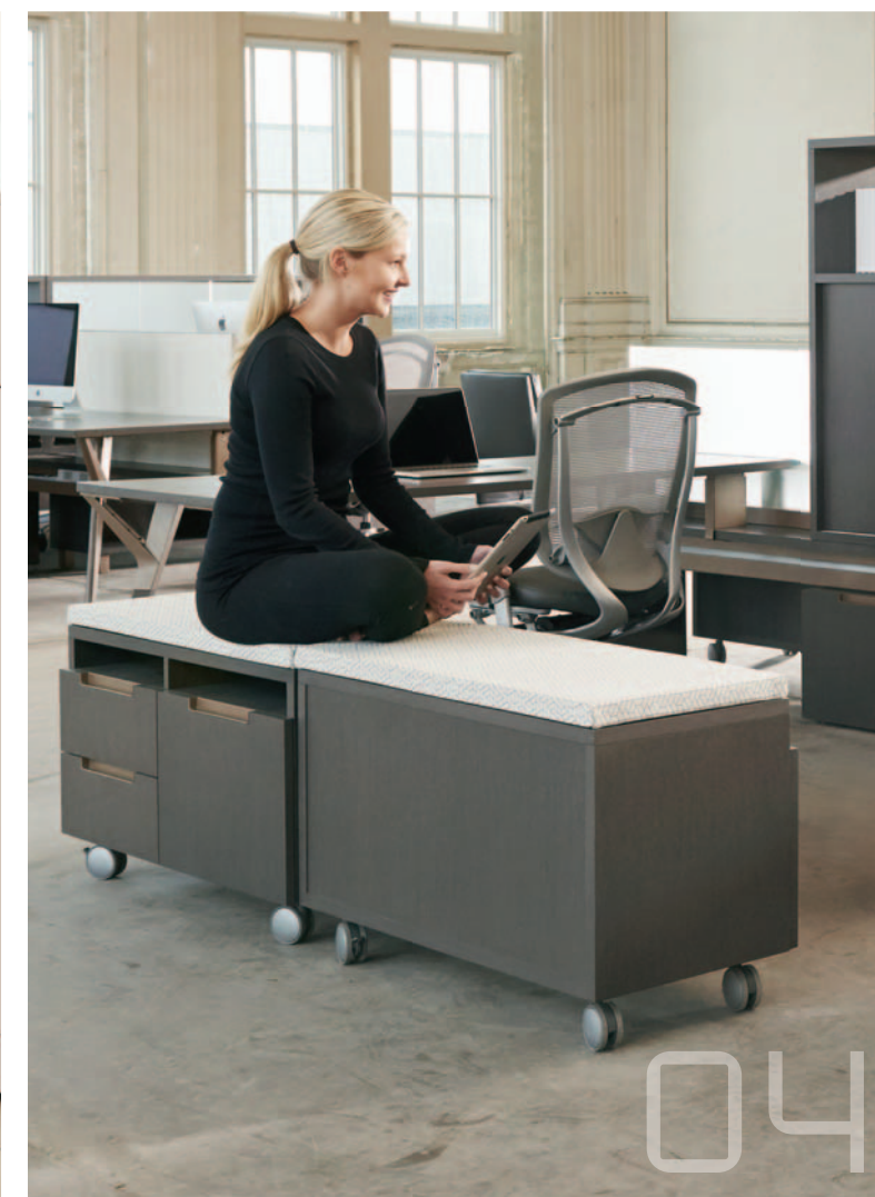
04 bahut mobile upstage

L'armoire latérale en métal Interpret est l'occasion d'utiliser la couleur de façon distinctive pour faire ressortir la forme unique des rangements et des accessoires Interpret.