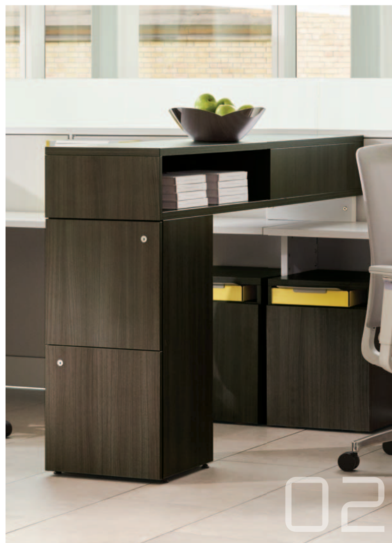
02 armoire latérale en bois interpret

La gamme District propose une sélection de rangements élégants, notamment des armoires ouvertes et fermées, des bahuts et des tours qui conviennent tant aux configurations verrouillables qu'aux présentoirs.