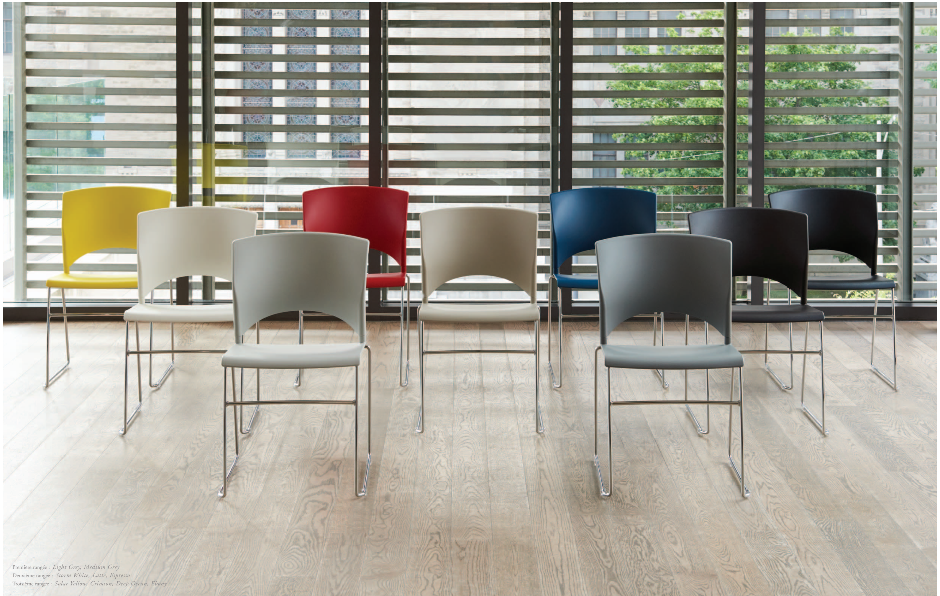
Première rangée : Light Grey, Medium Grey Deuxième rangée : Storm White, Latte, Espresso Troisième rangée : Solar Yellow, Crimson, Deep Ocean, Ebony